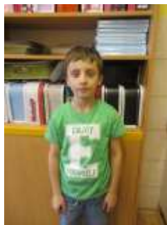
3.B Lexík 9 let Lego